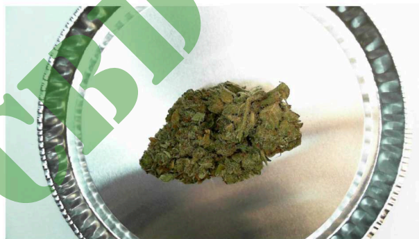
Bild der eingelangten Probe vom 27.09.2021